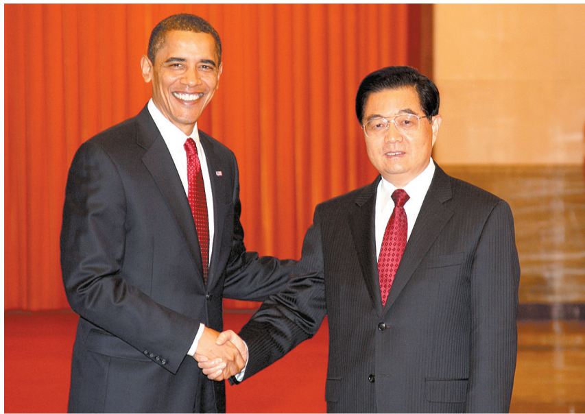
17日,国家主席胡锦涛在北京人民大会堂主持仪式,欢迎美国总统奥巴马访华。