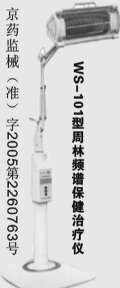
京药监械(准)字2005第2260763号

地址: 经五路与红专路交叉口向北30米路东 市内张仲景、老百姓、仝禧堂大药房有售