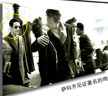
萨科齐见证著名的吻