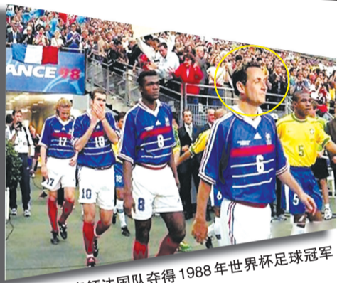
率领法国队夺得1988年世界杯足球冠军 网友恶搞的一组图片