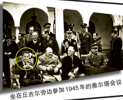
坐在丘吉尔旁边参加1945年的雅尔塔会议