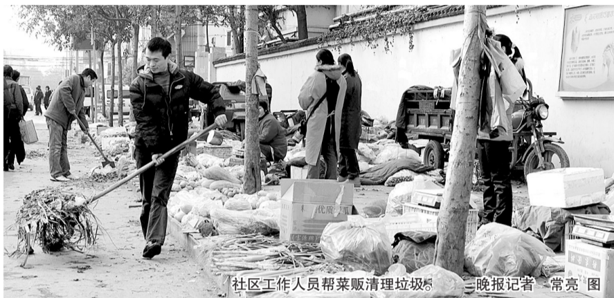
社区工作人员帮菜贩清理垃圾。