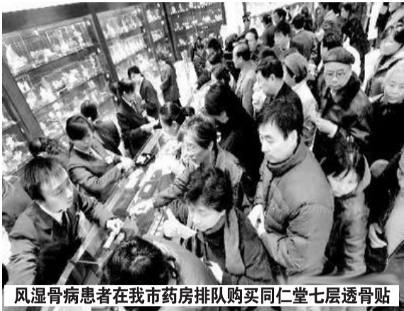
风湿骨病患者在我市药房排队购买同仁堂七层透骨贴

十月份以来，【同仁堂】七层透骨贴举办了疗效体验活动，前来参加的10000名骨病患者都亲身体会，充分验证