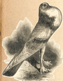
达尔文笔下的英国凸胸鸽

达尔文当时已注意到,尽管人们饲养的不同品种的鸽子外形各异,但它们可能有一个共同的祖先。他因此研究了各种活鸽子、鸽子蛋甚至是鸽子血,并绘制出一张包括凸胸鸽、扇尾鸽、信鸽等不同种类鸽子的家族谱系图。如果沿着这个方向走下去,达尔文真有可能撰写出一本《论人工饲养的鸽子起源》。