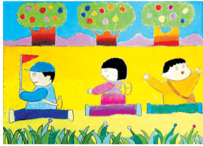
郊游 6岁作于列奥纳多 26.7cm x 38.2cm