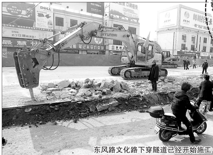
东风路文化路下穿隧道已经开始施工

具体交通管制范围如下，一、东风路(信息学院路至渠西路)段封闭施工，机动车禁止通行；二、渠西路(东风路至文劳路)段，机动车实行由南向北方向单行；三、文劳路(渠西路至信息学院路)段，机动车实行由东向西方向单行；四、信息学院路(文劳路至俭学街)段，机动车实行由北向南方向单行；五、俭学街(信息学院路至文博西路)段，机动车实行由西向东单行；六、以上单行道路由于道路较窄，公交线路也需按照单行方向行驶，同时一切车辆不得在单行路段停放。