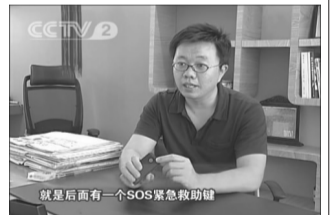
今年8月,中央电视台专题报道老人宝手机上市的消息。

老人宝手机背面特别设置醒目的SOS紧急求助键,可置入儿女、医生等四个电话号码和一条紧急短信。遇到紧急情况按下此键,手机发出高音量报警声,自动向预设的四个号码发出紧急短信,同时连续拨打,直到接通为止,为老人争取每一秒的救助时间。