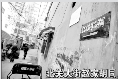
北关大街赵家胡同

“你注意赵家胡同的路牌了吗?这种搪瓷烧的路牌现在郑州几乎都见不到了。”老人告诉记者,可别小看这路牌,它是上世纪60年代,政府统一在天津烧制成的搪瓷牌,蓝底白字,一般一次烧两套,一套投入使用,另一套备用。