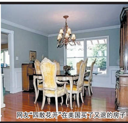
网友“四散花开”在美国买了又退的房子