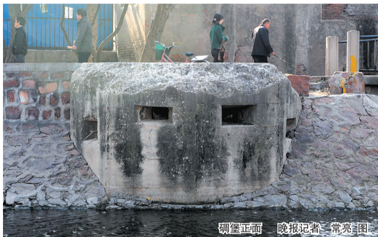
碉堡正面

记者打探,得知文物普查中曾作过登记 遗憾的是无人知道它的来历,《读者》寻找知情人