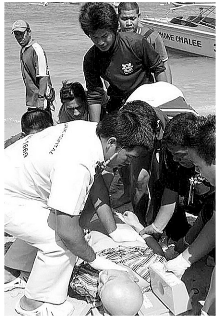
救援人员营救撞船事故伤者