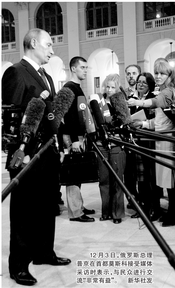
12月3日,俄罗斯总理普京在首都莫斯科接受媒体采访时表示,与民众进行交流“非常有益”。

俄罗斯总理弗拉基米尔·普京3日通过电视直播节目与公众直接交流,4小时内回答大约80个问题,内容以经济和民生为主。路透社报道说,热心民众通过电话、互联网和手机短信提出超过200万个问题。