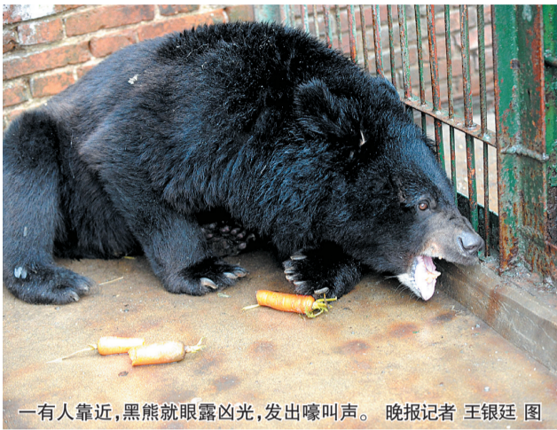
一有人靠近,黑熊就眼露凶光,发出嚎叫声。

2日下午,登封动物园黑熊突然发狂咬死饲养它两年多的老谢,报道引起了社会各界极大的关注,市民纷纷发表看法,不少市民对黑熊行凶的原因及未来表示关注?更多市民关心的是这场惨剧的背后,这个动物园是否有合法手续?动物园的管理存在哪些问题?受害人如何赔偿?谁来对这起惨案担责?从这起血淋淋的事件中,人们该吸取什么教训? 晚报记者 袁建龙 马燕