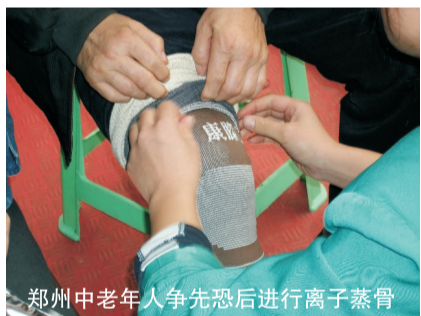
郑州中老年人争先恐后进行离子蒸骨

郑州市林业局野生动植物保护处的尚处长说,目前国家尚未出台“如何处罚伤人或咬死人的野生动物”的规定,只是有对野生动物的一些保护条例。由于黑熊属于国家二级保护动物,只能对黑熊加强管理和保护,无法像对待杀人的犯人一样,对其判处死刑。