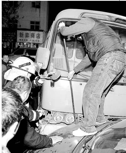
为了将两车分开，切割机、高压气囊、撬杠全都用上了。

随着高压气囊一点点打开，18时35分，咬在一起一个多小时的汽车，终于分开。 线索提供 王江