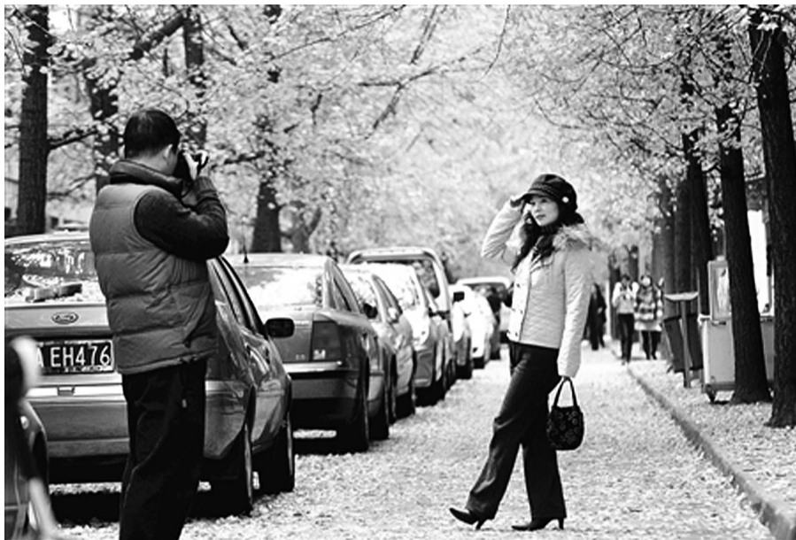
看看成都落叶美景

日前，有媒体报道，成都市经过筛选已确定12条街道、6个街心花园，实行“只拣不扫”，全力打造“银杏小径”落叶景观。现在成都的大街小巷、公园河畔，到处都是一派落叶缤纷的景象。在冬风的吹拂下，道路两边的银杏树金黄一片，将整条街区映衬得美不胜收。图为成都市民在落叶满地的路上留影。(资料图片)