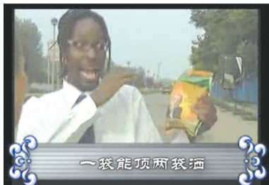
从截屏可以看到,广告中有不少错别字。

以前只听说过“土坷垃”,可如今流行“金坷垃”。近日,随着一段“老外打架”的视频广告热播后,一个“拯救世界农业的先进技术”横空出世。这段宣传“金坷垃”肥料的广告,已不能够用“雷人”来形容,只能说是“焦人”了——它能把你雷成黑炭,皮焦肉烂,无话可说。