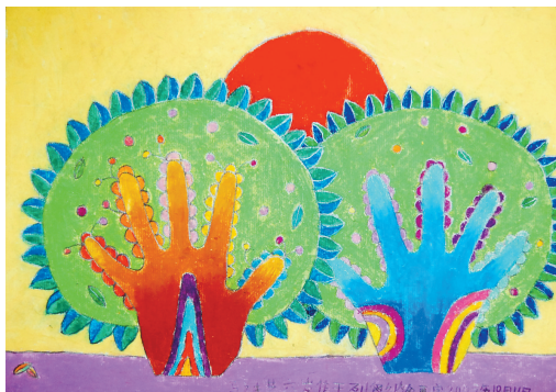
两棵树 6岁作于列奥纳多 26.7cm x 38.2cm