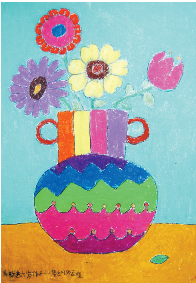
瓶花 6岁作于列奥纳多 38.2cm x 26.7cm