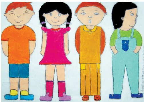
四个小朋友 6岁作于列奥纳多 26.7cm x 38.2cm