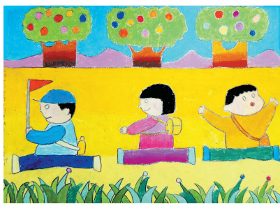
郊游 6岁作于列奥纳多 26.7cm x 38.2cm