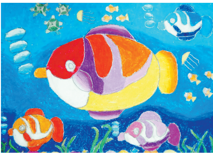
金鱼和小龟 6岁作于列奥纳多 26.7cm x 38.2cm