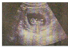
传统B超可视手术观察子宫