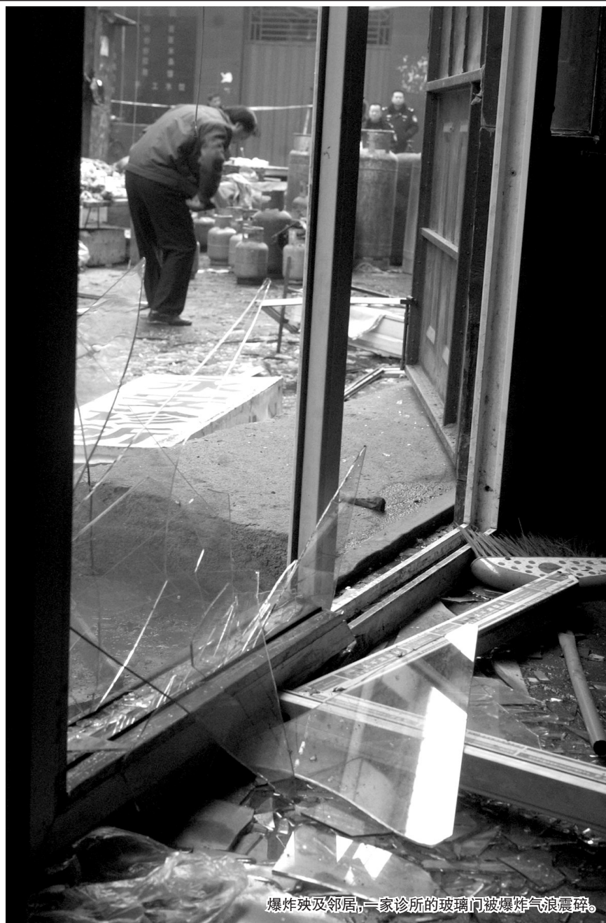
爆炸殃及邻居,一家诊所的玻璃门被爆炸气流震碎。