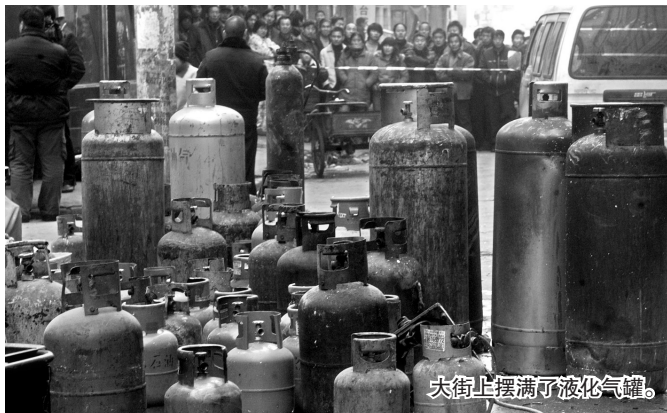
大街上摆满了液化气罐。