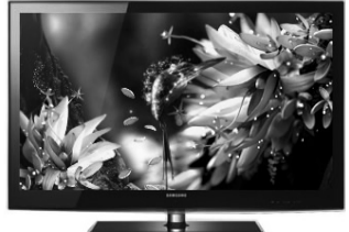
赠送物品以卖场实物为准

洗衣机方面,三星以独创的“银离子杀菌”和“钻石型内筒”为基础,实现“低磨损、健康洗衣”的飞跃;新增“随心洗”和“智能烘干”等智能化功能,可做到“15-60分钟,6档时间随意设定”、“衣干即停”,打破传统的“洗衣时间禁锢”。三星冰箱的“新生双循环系统”完美解决了串味难题,而“天然保鲜室”可有效降解果蔬表面残留农药;同时,坚固美观的钢化玻璃搁架、便捷实用的家庭冰吧、节能省电的假日功能等人性化设计也成亮点。三星国际大品牌的高端品质,再加上“豪礼相赠”和“购买返现”等真正送实惠的大力促销,如此良机,想选购家电的朋友绝对不能错过。