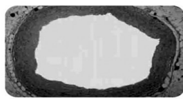
显微镜下正常冠状动脉

从海参、鲍鱼、原花青素中提取,对心血管病、糖尿病、胃病、眼病、便秘、失眠、前列腺、肾虚等多种疾病效果特别好!