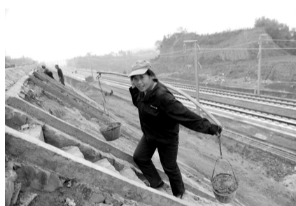
沿线防护设施 晚报记者 王银廷(资料图片)

建设时期的防护网是铁质的,现在已经具备了试运行的条件,在联调联试过程中开始更换防护网,由过去的铁质网,全部更换成水泥柱的永久性防护网,以防止铁路沿线的居民随意穿越铁路,保障沿线居民的生命安全。