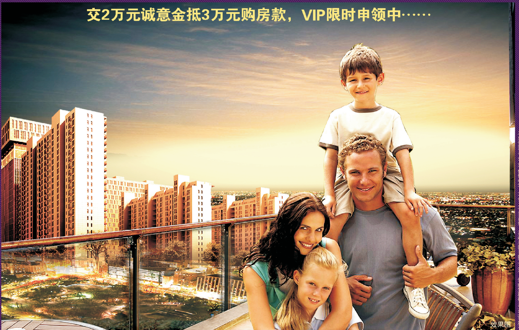
本广告内容及文字仅供参考，不作为合同要约，以政府审批文件为准，最终以售楼部白页为准。

多功能房的异想天开 可以作为书房、视听室、客房，私享精神领域 无论是三口之家还是三代同堂，都能各享其乐。