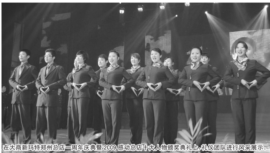
在大商新玛特郑州总店一周年庆典暨2009感动总店十大人物颁奖典礼上，礼仪团队进行风采展示。