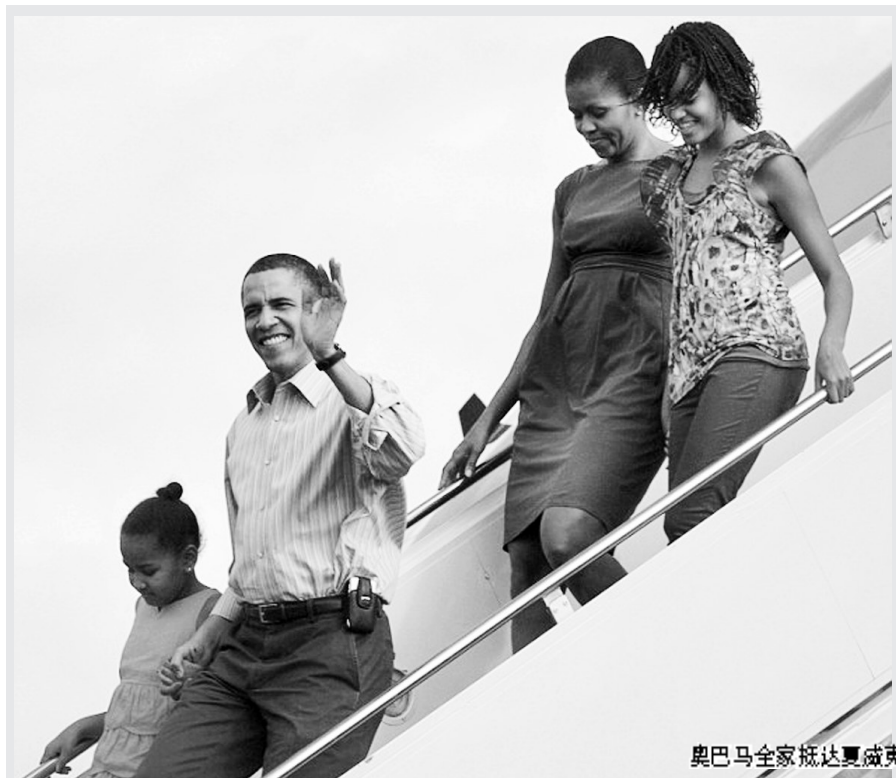
奥巴马全家抵达夏威夷

国会众议院11月通过众院版医改法案。作为医改立法下一步进程,参议院与众议院接下来会展开磋商,由两院联席委员会负责形成法案统一文本。共和党坚决反对这项法案。参议院表决结束后,共和党人誓言“抗争到底”。