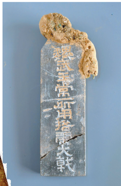
出土文物上有“魏武王”字样