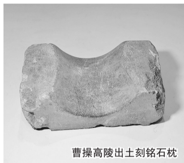
曹操高陵出土刻铭石枕