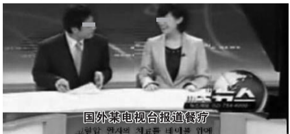
国外某电视台报道医疗

早餐期间,你一杯热水一粒吸脂膳,然后闭目静坐5到10分钟,慢慢地,你就会感觉头脑轻松,嗅觉灵敏,口舌生津,四周声