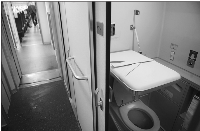
卫生间可折叠的婴儿护理台。

洪先生走进G10317号车厢,坐惯了飞机的他看到车上的座椅满意地露出了微笑,座椅与座椅之间的距离不仅比飞机上的要大一些,座椅也要比飞机上的宽一些。