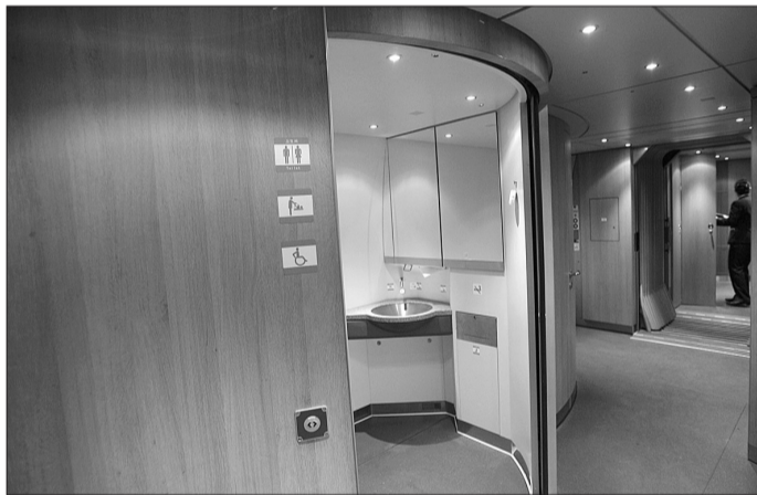
列车上有两种洗手间,空间都较大,其中一种能自动锁门。