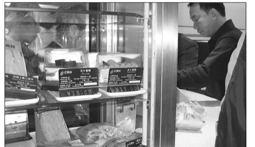
吧台所提供的食物主要以速食为主,价格也不是很贵。