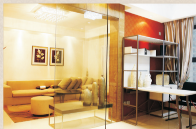
◎永威·西苑样板房实景拍摄

◎特有景观阳台赠送，可置一房；书房、卧室、琴房、健身房自由随心，两房轻松变三房超值拥有