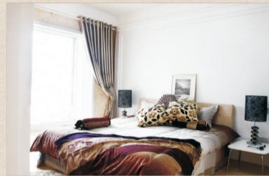
◎永威·西苑样板房实景拍摄