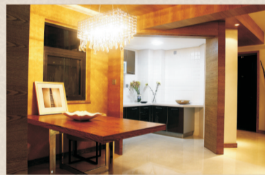
◎永威·西苑样板房实景拍摄