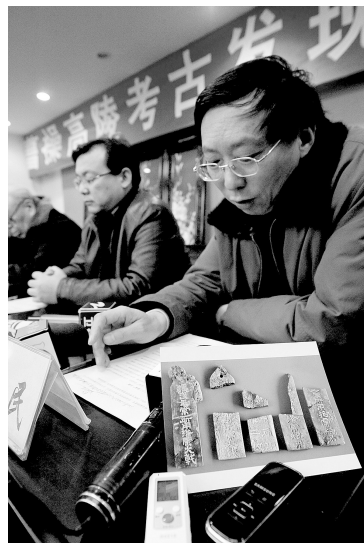
去年12月31日，河南举行“曹操高陵”考古发现说明会，专家在回答记者的提问

至于一个曹操墓能给当地带来4个亿的说法应该没有什么依据，也不知道是怎么算出来的。目前总体规划还没有出来，容纳量等各种数据也没有计算出来，怎么就能算出4个亿？考古是个学术问题，不能掺杂其他利益在里面。