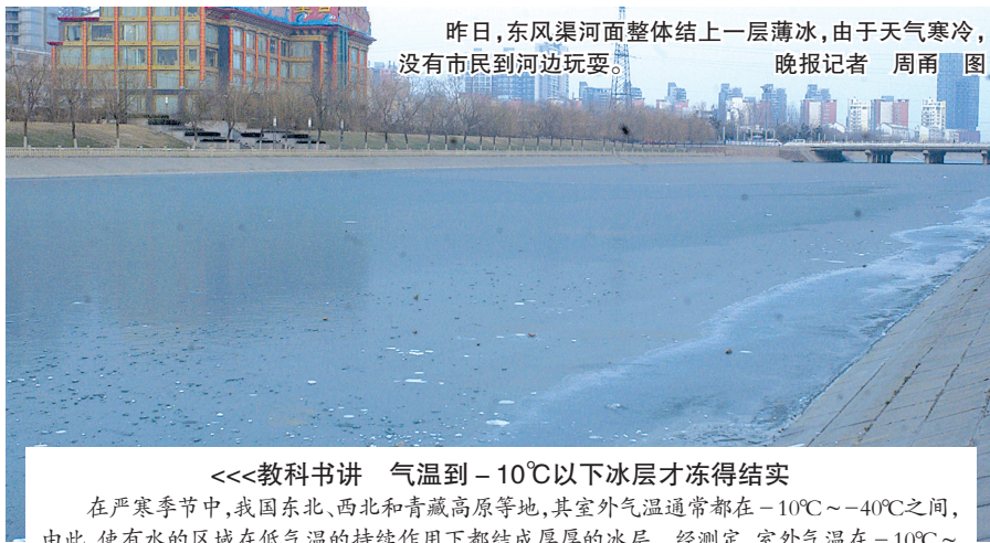
昨日,东风渠河面整体结上一层薄冰,由于天气寒冷,没有市民到河边玩耍。

“结冰后多厚的冰层安全,需要根据冰承受的压力和冰承受力的系数才能测算出来,而且不同的情况,测算出来的数据也不同。”专家没有给出具体意见,他提醒,目前处于结冰时间段,建议市民不要站立冰面上玩耍,万一不小心掉下去,就算没生命危险,弄湿了衣服也会生病感冒。