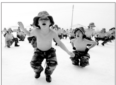
1月6日,在韩国首尔附近,学生们在雪地中赤膊参加军训。

约300名大中小学学生参加这个由韩军退役海军陆战队员指导的冬训营,参训时间从3天至14天不等,以提高身心耐力。