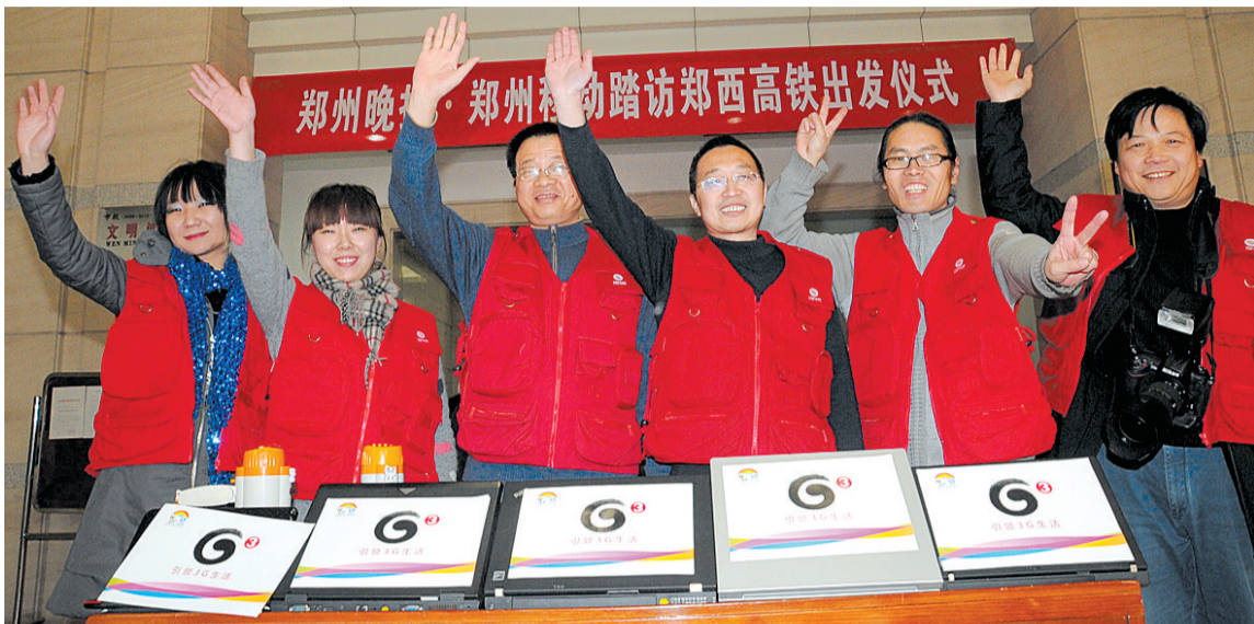
昨日,由本报记者和郑州移动员工组成的郑西特别报道组踏上了征程。