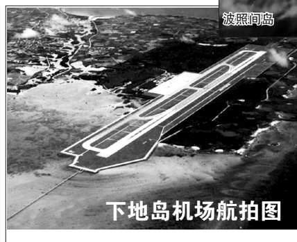
下地岛机场航拍图

目前,下地岛机场有一条 3000 米长、60 米宽的主跑道,和一条 3880 米长、30 米宽的滑行道,另有 5 个供大型喷气式客机使用的停机位和 1 个供中型喷气机使用的停机位,停机坪面积近 13 万平方米。由于机场一直用于大型飞机训练,因此各项配套设施齐备,且目前并无固定航班,在转为军用时“麻烦”较少。