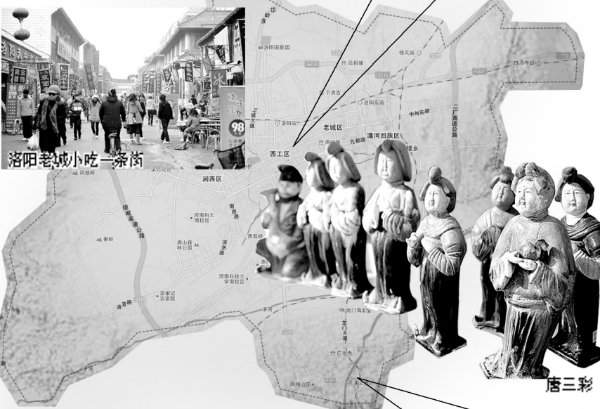
洛阳老城小吃一条街