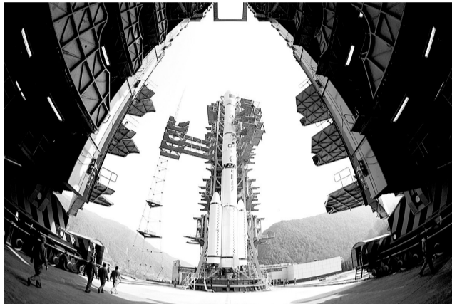
1月16日15时45分,中国第三颗北斗导航卫星在活动塔移开后露出真容。

这次发射的卫星和运载火箭分别由中国航天科技集团公司所属中国空间技术研究院和中国运载火箭技术研究院研制。这是长征系列运载火箭的第122次飞行。