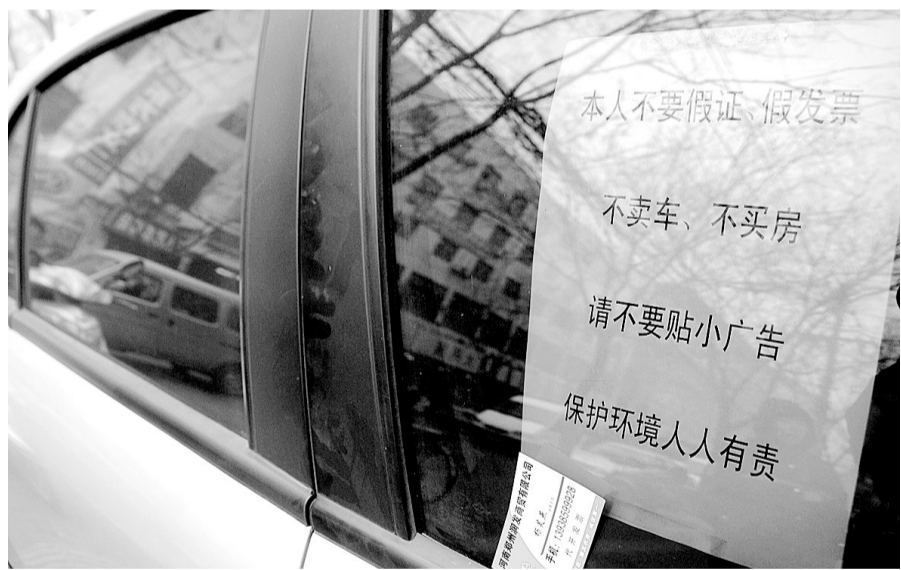
▲虽然车窗上贴着声明,但是小广告依然塞到了车窗上。

本报讯 昨日上午,家住伊洛路嵩山饭店附近的杜女士,不堪各类卡片的骚扰,一怒之下,打印出一张帖子,贴在车前显眼位置,提醒“塞卡族”不要往她的车上塞卡了。 那张“辞帖”这样写道:本人不要假证、假发票,不卖车,不买房,请不要贴小广告。保护环境,人人有责。 杜女士说,就因为她家住在宾馆附近,不论车停下没有停下,往往一个小时内,车玻璃缝中就会被人塞上几张卡片。“这些卡片我要一张一张地拔出,扔掉吧,是对附近保洁人员的不尊重,不扔吧,看着就生气。” 线索提供 王先生