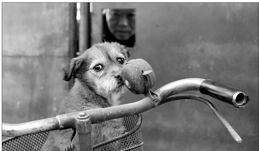
一只生病的狗狗被主人用自行车推到救助站。