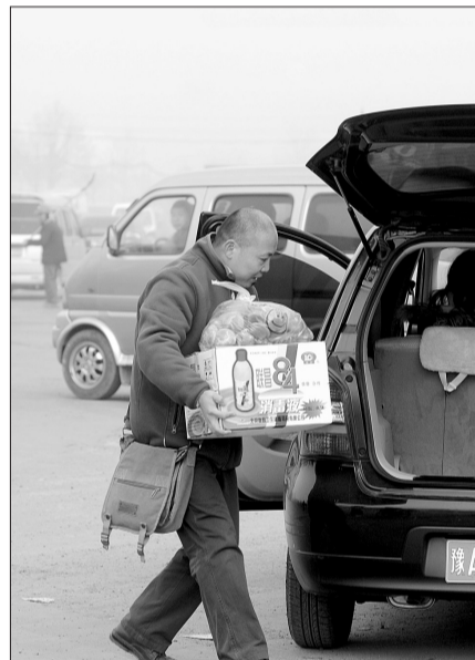
1月17日早上,在森林公园附近,网友“远离尘曦”将准备好的蛋糕和84消毒液装到车上。