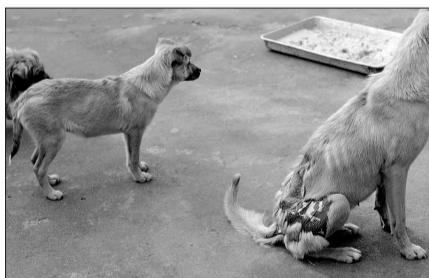
一只被烫伤的流浪狗在救助站找到了属于自己的“家”。