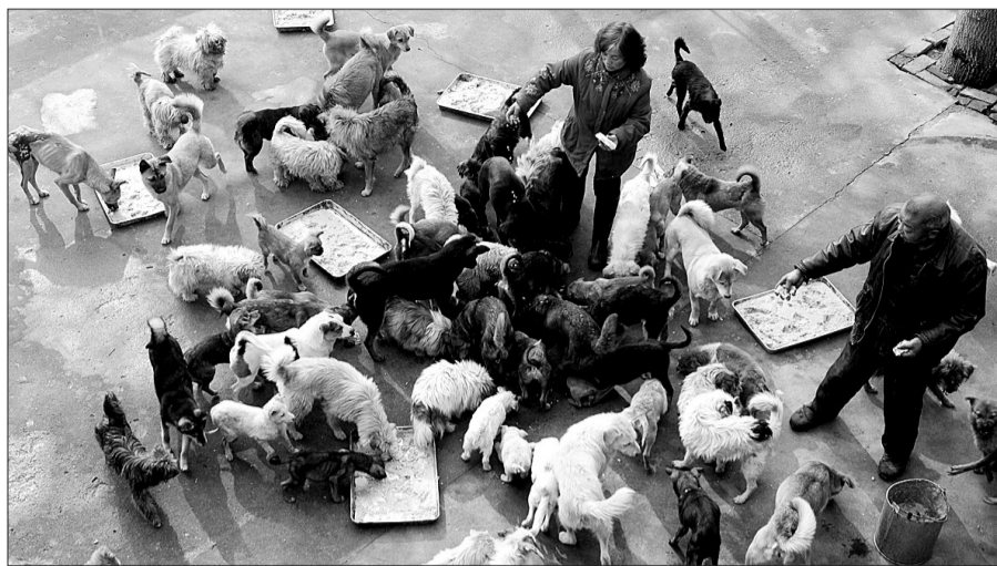
100多只狗狗吃饭的场景十分壮观。