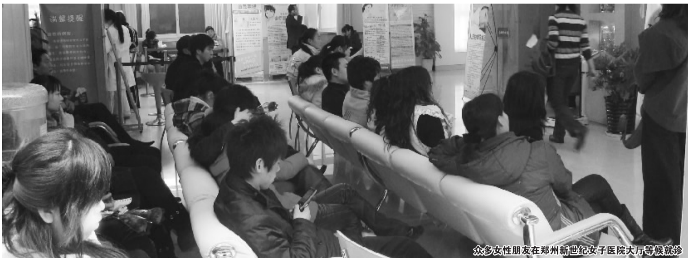
众多女性朋友在郑州新世纪女子医院大厅等候就诊

“看妇科治不孕医疗报销公益活动”自1月8日启动以来持续升温,无论是报销热线 0371—67353333 还是活动官方网站 http://www.zzxsj.net 都在不断接受女性朋友电话或网络预约的就医,主动前来参加不孕不育、子宫肌瘤、意外怀孕、妇科炎症等妇科疾病普查及诊治的女性朋友也日益升温,作为此次公益活动指定医疗机构的郑州新世纪女子医院已为众多女性朋友实施了看病报销政策。很多女性朋友纷纷表示,活动组织得很好,平时很少有这样技术先进、权威专家坐诊、医疗费用报销的公益活动,并希望郑州新世纪女子医院能多组织类似的健康活动,以缓解女性“看病难、看病贵”。