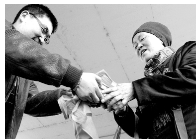
多年的积蓄找回来了。