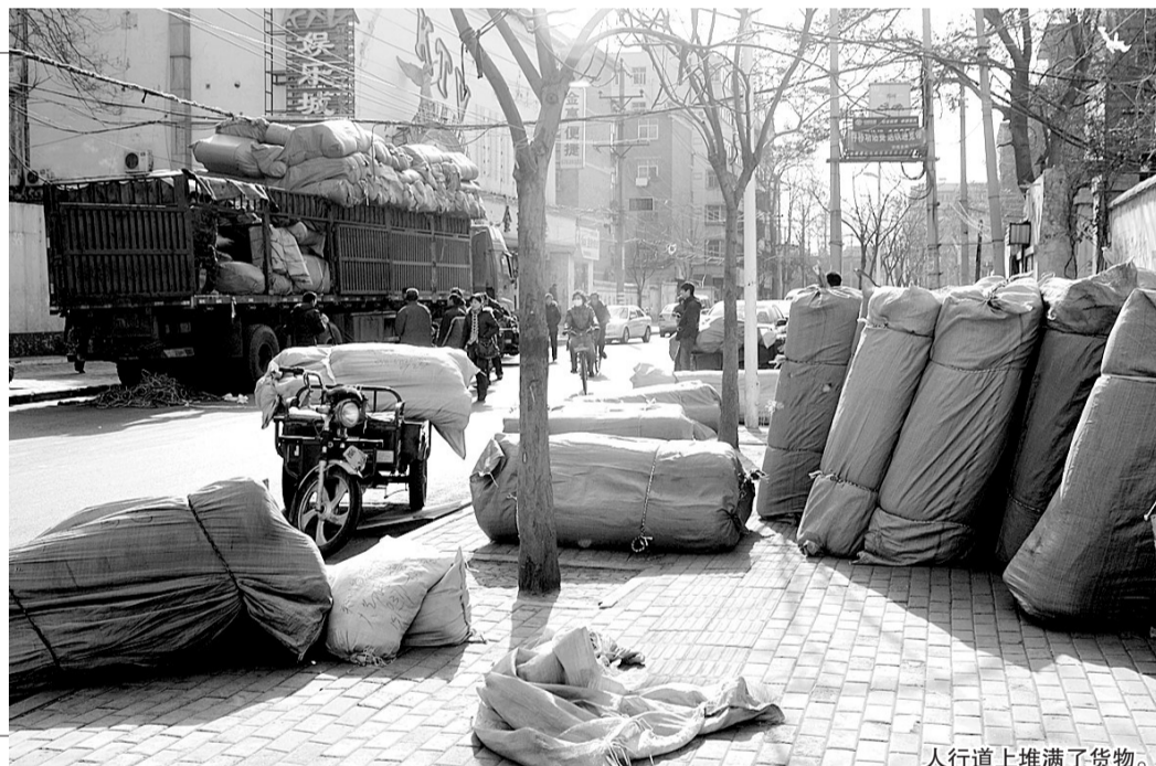
人行道上堆满了货物。