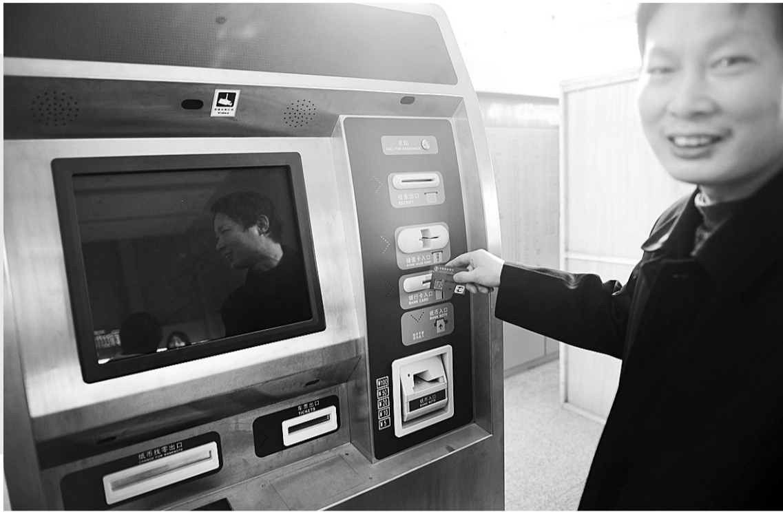
西站售票大厅设置的自动售票机,现金、银行卡都可用。