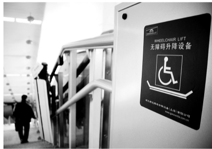
无障碍升降设备

台,刚建成的无柱风雨棚看起来像只展翅的蝴蝶,棚顶镶嵌的白色日光灯在夜晚散发出白昼般的光亮。蓝色的玻璃幕墙包裹着新建的无障碍电梯,和别的站台上的电梯相比,显得科技含量十足。同样在通往西站厅的楼道口,在标有残疾人座位的标记旁,精巧的“无障碍升降设备”在没有人为需要时为折叠状态,整个似一个小的折叠桌,厚薄不到10厘米,依附于扶梯。“可别小看它,有残疾人需要帮助下楼梯时,我们工作人员会启动装置,残疾人坐上去后再启动绿色按钮,它可以带着人匀速下降。”据了解,该设置最高承重可达到250公斤。