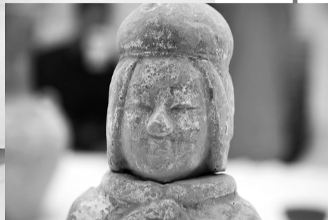
被盗墓者盗走的珍贵文物。