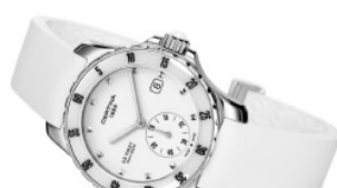
荣耀系列陶瓷女表