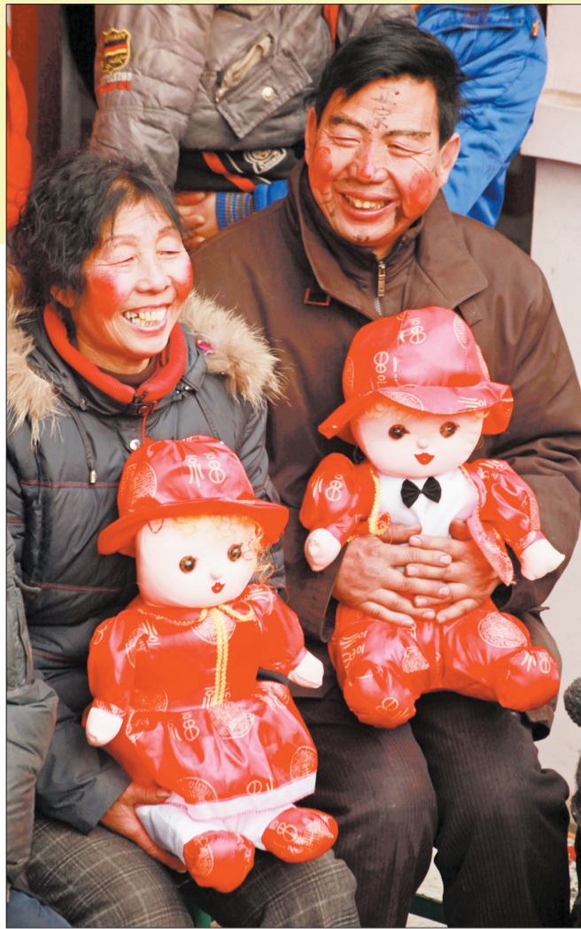
▲婚礼仪式上的新郎父母抱着象征多子多福的玩具娃娃。