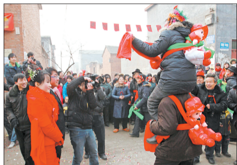
▲新郎父亲驮着新郎母亲,扭起欢快的大秧歌,迎来了漂亮的儿媳。

这是日前在河南省林州市姚村镇武家泊村一户农家举行的传统婚礼。新郎的父亲和母亲抹着夸张的大花脸,肩背象征多子多福的玩具娃娃,在喧天的锣鼓和鞭炮声中,与亲戚朋友扭着欢快的大秧歌,迎来了美丽的儿媳妇。