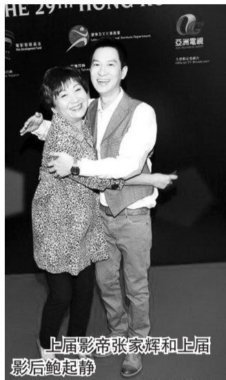
上届影帝张家辉和上届影后鲍起静

昨日,第29届香港电影金像奖入围名单公布,《十月围城》以19项提名领跑,创历史新高,《赤壁:决战天下》以13项提名紧随其后,《十月围城》《赤壁:决战天下》《音乐人生》《窃听风云》《新宿事件》获得最佳影片提名。演员方面,赵薇、李宇春、任达华分别获得两项表演奖提名。本届金像奖颁奖典礼将于4月18日举行。