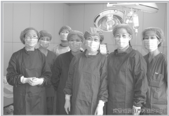
武警医院妇产科医疗团队

率先应用于妇产科医疗领域的高新技术,同时也是唯一能超微精准检查诊断,清晰可视发现病灶、清除病灶、且定位精准而不损伤周围组织的妇科微创领域最前沿科技的产物。