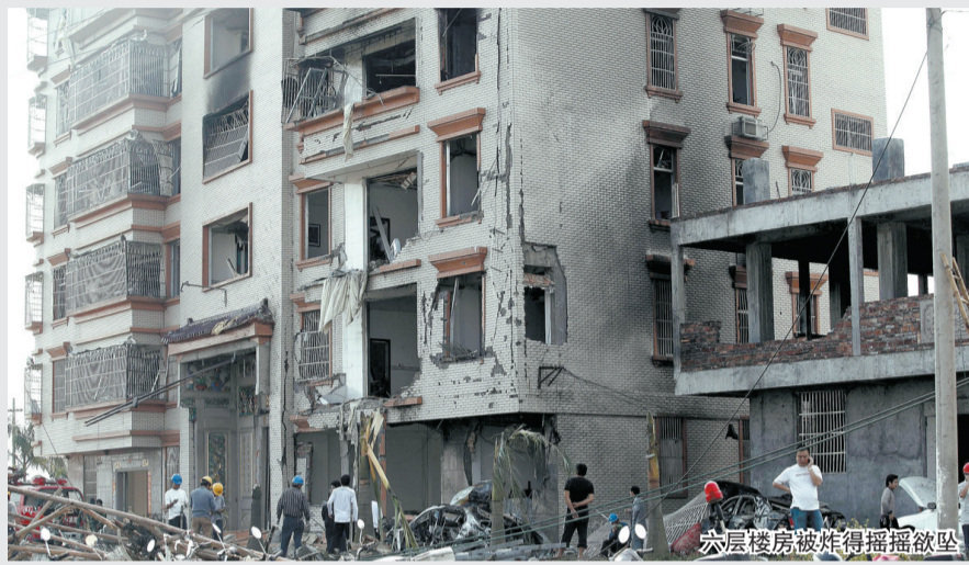
六层楼房被炸得摇摇欲坠

从大年除夕到正月十五，点爆竹、放烟花为节日增添了喜庆气氛。然而2月26日晚上，广东普宁一户村民因非法燃放烟花引起爆炸事故，导致死21人、伤48人的惨剧。在普宁所处的粤东农村地区，传统年节燃放烟花爆竹十分盛行，此前甚少引发大规模安全事故。此次事故是如何发生的？记者调查发现，事故的罪魁祸首并非烟花爆竹本身，而是燃放者缺乏起码的安全意识和燃放技术。