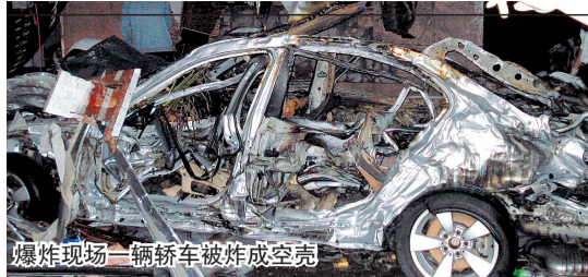
爆炸现场一辆轿车被炸成空壳